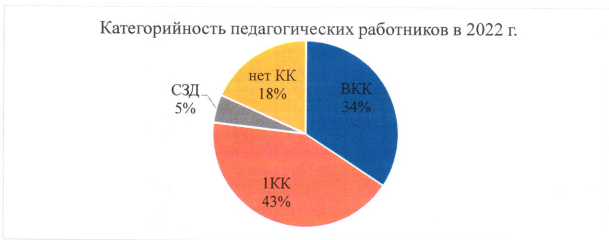
Рисунок 2 – Соотношение квалификационных категорий учителей в 2022 г.

Статистика по повысившим квалификацию в течение 2020-2022 гг. представлена в таблице 2 и на рисунке 3.